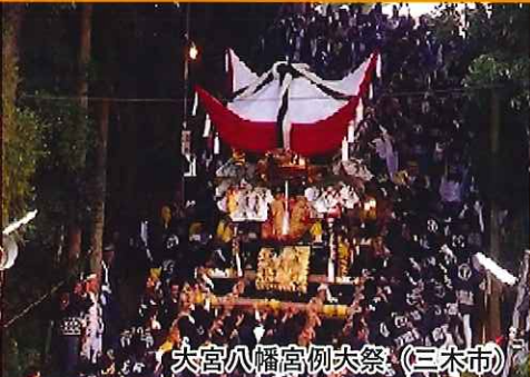
大宮八幡宮例大祭 (三木市)