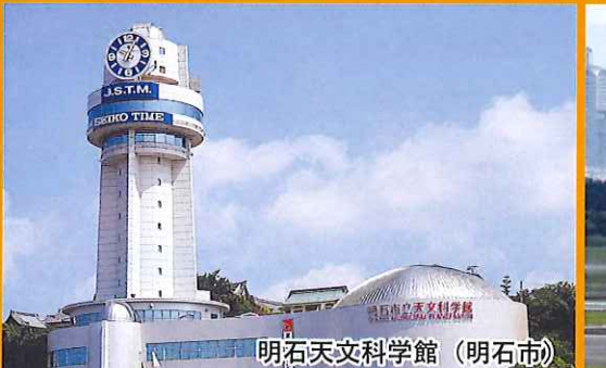
明石天文科学館 (明石市)