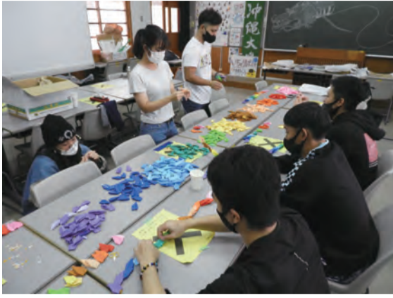
全国の参加予定者から預かっていた折り鶴をリーダーとして参加予定だった沖縄大学学生に託しました

日本PTA総会以降にスタートした事業のため、参加予定の中学生が受験時期と重なる地域もあり、全ての方からの返信は難しかったものの、想いの詰まった「私の夢、チャレンジ宣言！」をお届けする準備をしています。保護者の方々からも、中止になったことによる