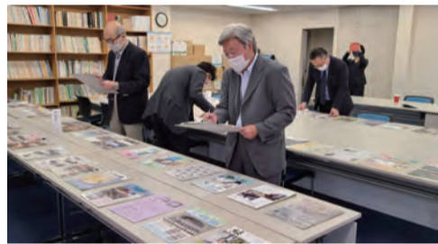
力作揃いの最終審査会でした

優秀作品に選ばれた団体に対し、令和2年11月27日(金)に開催した年次表彰式にて表彰を行いました。さらに、入賞作品を掲載した「第42回優秀広報紙作品集」を発行します。