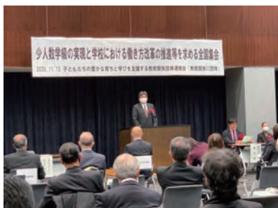
萩生田文部科学大臣もご臨席