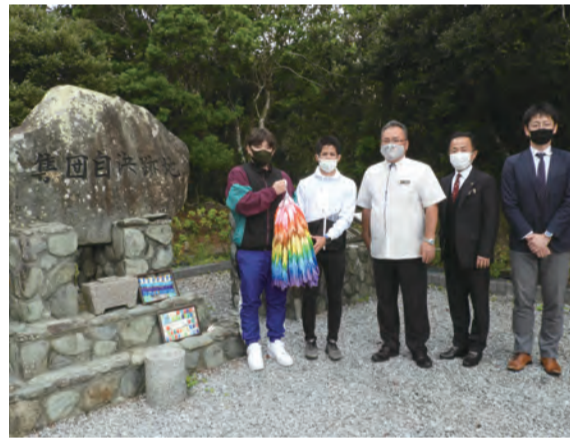
渡嘉敷村の集団自決慰霊碑へ千羽鶴を届けました

今年度はコロナ禍の中で、子どもたちは多くの制約や我慢を強いられ、「あきらめ」の気持ちを抱きやすい状況にあります。そんな時だからこそ、私たち大人が物事を前向きに考え、子どもたちの成長する機会を創出することの必要性を理解する者として率先して行動を起こしたいと考えました。しかし、1月7日「新型コロナウイルス感染症の緊急事態宣言」が一部三県に発出されました。新型コロナウイルス感染症が拡大している状況を受け、生徒及び関係者の健康・安全面を第一に考慮した結果、事業の開催の中止を決断いたしました。