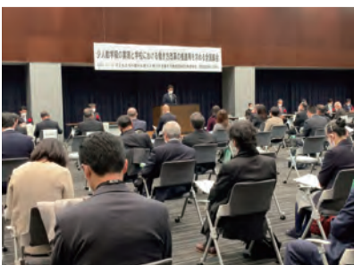
広い場所にて間隔をあけて着席

少人数学級の実現と学校における働き方改革の推進等を求めるアピール 次年度以降の検討は、すべての大人の願いであり、子供たちが全国どこに生まれ、どこで育ち、どこで学ぶ権利を保障し、誰もが安心して学べるよう努めます。また、本アピールの趣旨を実現するためには、教育の質の向上と教育の普及の向上を図るため、スクールカウンセラーやスクールソーシャルワーカーの配置促進やSNS等を活用した相談体制の構築等も、また、地方財政を圧迫し、人材確保に支障を生じ、地域間格差を生じたりすることのないよう、教育関係団体連合会及び地方自治体の財政支援を行うこと、教育関係団体連合会が、国の重要事項であること、右に掲げられた事項の実現については、関係の教育関係団体等それぞれにおいて、計画的・安定的な財源確保を行うこと。 令和二年十一月十二日